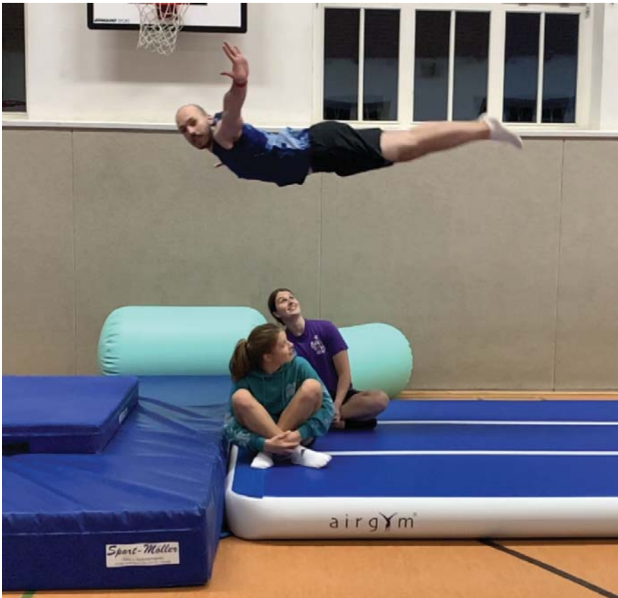
Überflieger mal anders

seitdem heißt es nun nicht nur auf dem Trampolin „auf die Plätze, fertig, springt!“, sondern auch auf der federnden Matte beim Bodenturnen. Und das bedeutet sowohl für unsere Kleinsten, als auch für die Jugendlichen eine Menge neuer Spaß. Vorbei die Zeiten, als langweiliges Rundenlaufen zum Aufwärmen angesagt war, und jetzt machen auch die Pausen zwischen den Trampolindurchgängen auf einmal richtig Laune: Da turnen dann die Aktiven Rollen, Standsprünge, Hocken, Bücken oder auch mal einen Salto und alles auf der 10-Meter-Bahn natürlich hintereinander weg. Auch auf technischer Seite bringt die AirTrack-Matte viele Vor-